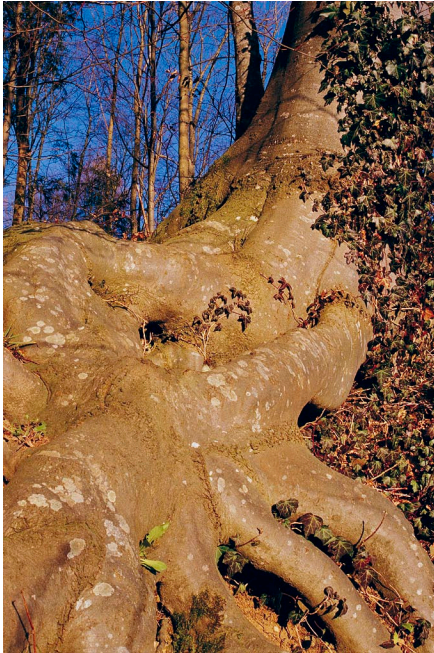
Wurzelskulptur bei Girenbad Druck: Medienhaus Mattenbach, Winterthur

SILIDUR AG übernimmt Mehrheitsaktienpaket von silisport ag