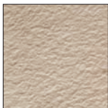
067 Beige geflammt