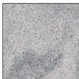
062 Grau geflammt