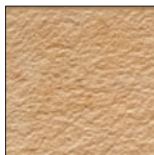
066 Apricot geflammt