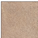
063 Braun geflammt